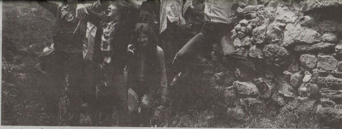
Los músicos de Casablanca, en el local de Lardero, en plena subida.

Rúper, entre sorprendido y entusiasmado por mi interés en el grupo, subraya el poderío musical de Casablanca: «El resultado, la suma de todas las aportaciones individuales, fue una orquesta nada convencional, ya que confeccionamos un repertorio ecléctico y divertido que incluía lo mismo un rock and roll que un chachachá o una marcha celta».